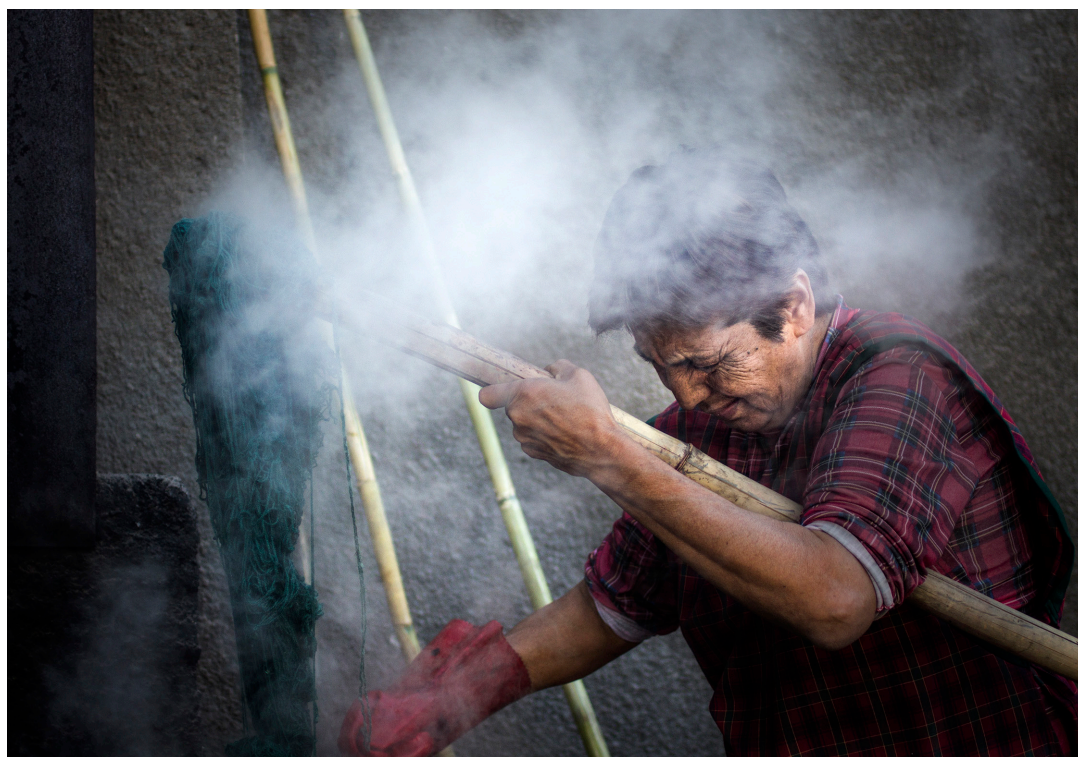
Cooperativa Tinku Kamayo, en Belén, Catamarca