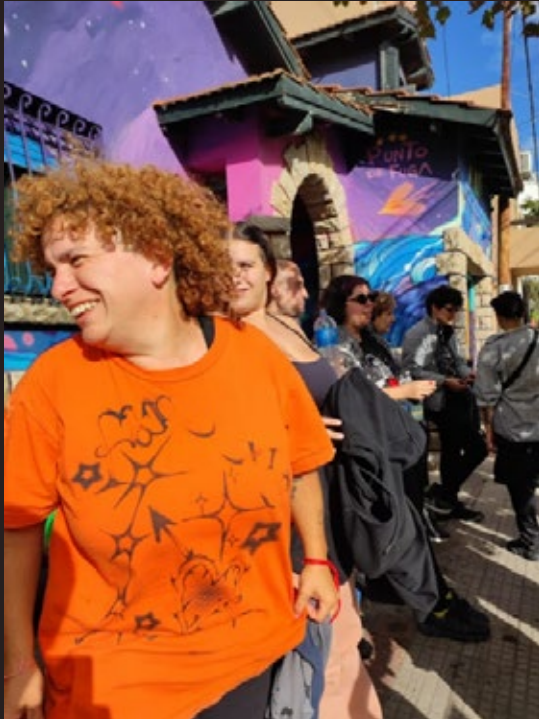
Si Pierina no fuera lesbiana, no estaría siendo objeto de este proceso de persecución.