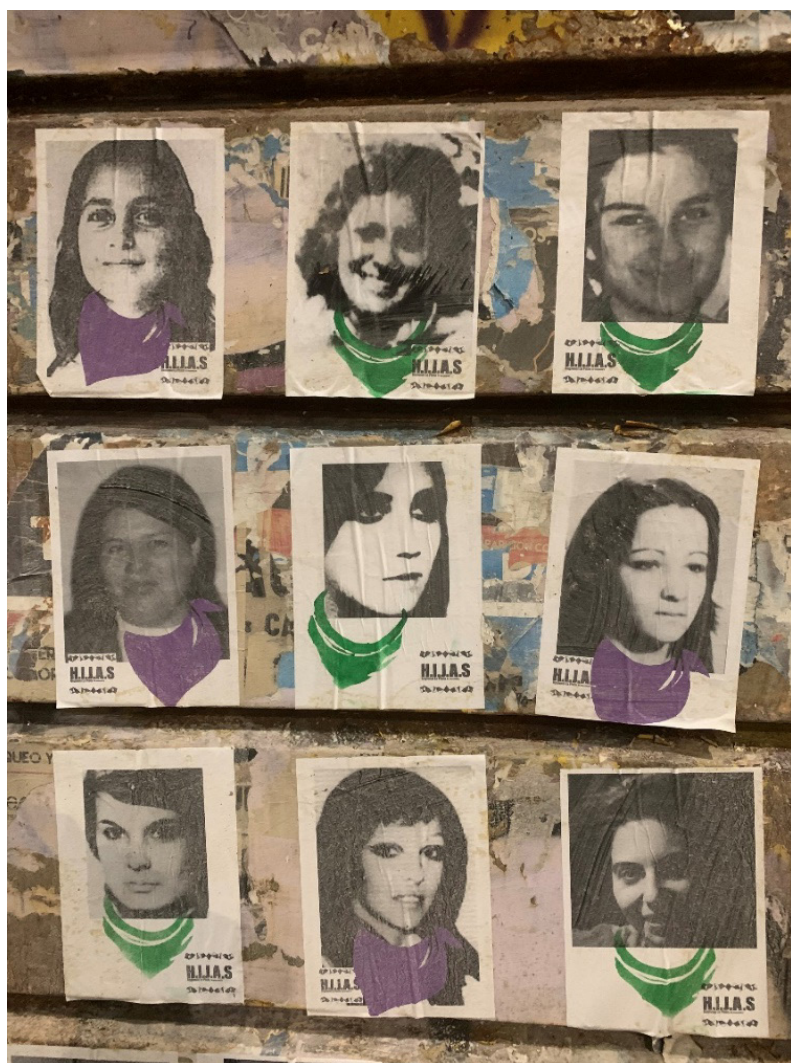
Figura 3. H.I.J.A.S.- Regional La Plata, Intervención con afiches, Encuentro Nacional de Mujeres, La Plata. Foto: Nayla Vacarezza (2019).

Plaza de Mayo, el #NiUnaMenos y los escraches. Previo a este conversatorio realizaron una acción callejera en el que pegaron afiches en las paredes de la calle con las clásicas fotos carnet en blanco y negro de las mujeres detenidas/desaparecidas -tal como se ven en las marchas del 24 de marzo en la bandera de los desaparecidos que las vertebraba-, intervenidas con la sobreimpresión de pañuelos verdes y violetas enlazados en sus cuellos (Figura 3).